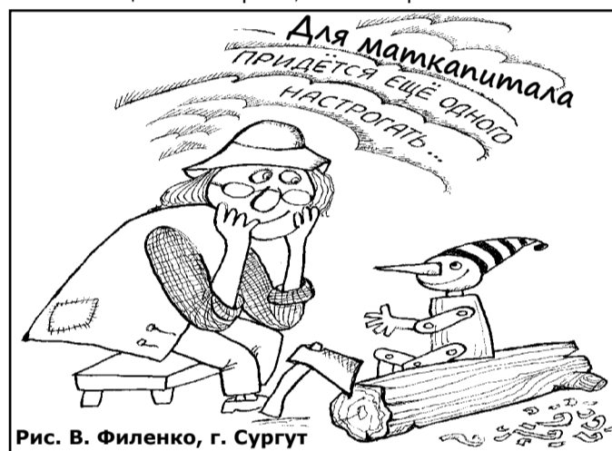
Рис. В. Филенко, г. Сургут

Что же касается «прорыва», то приведу сравнительные данные по патентам на изобретения в России: