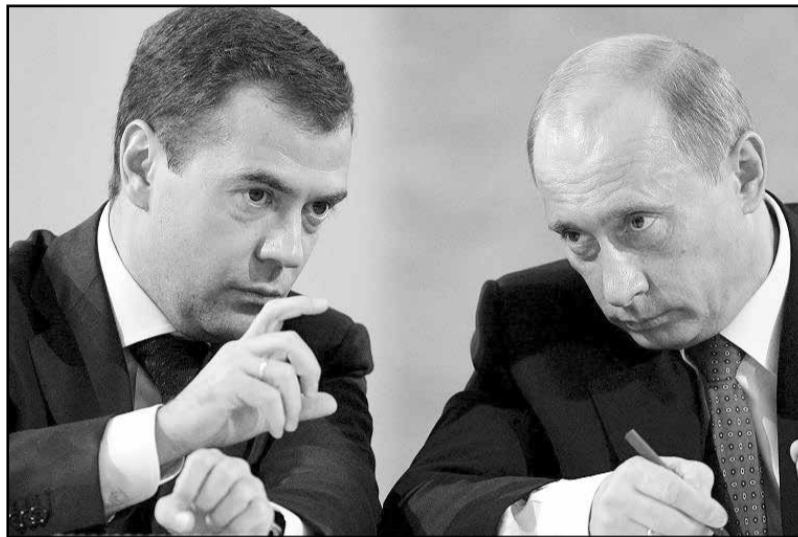
Можно еще поднять на 5 лет...

В июне 2017 года на «прямой линии» с президентом РФ Владимиром Путиным было рассказано о почтальоне, который получает зарплату 3600 рублей. В августе 2018 года резонанс вызвало видео из Вологодской области,