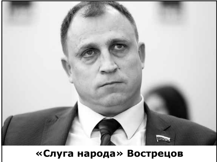
«Слуга народа» Вострецов

Дикость происходящего не останавливает капиталистов и чиновников. Глубоко заблужда-