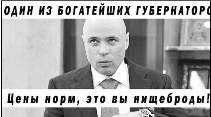
ОДИН ИЗ БОГАТЕЙШИХ ГУБЕРНАТОРОВ