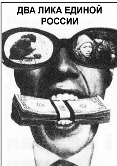
ДВА ЛИКА ЕДИНОЙ РОССИИ