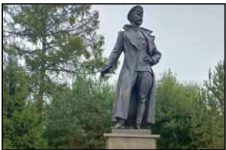
Памятник Дзержинскому в Омске