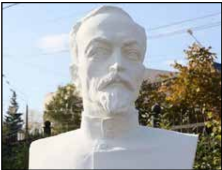
Бюст Дзержинскому в Нижнем Тагиле

19 сентября в экспозиции Парка советской скульптуры в Нижнем Тагиле (Свердловская обл.) появился бюст основателя и главы ВЧК Феликса Дзержинского. Скульптура прибыла в Нижний Тагил из Белоруссии. Восстанавли-