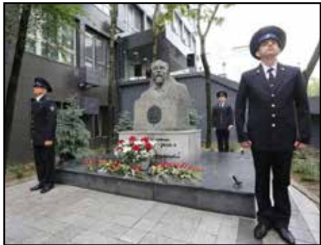
Памятник Дзержинскому во Владивостоке

Памятник представляет собой бюст в камне, а на гранитном постаменте выгравирована цитата Дзержинского: «За верой должны следовать дела». Монумент расположен рядом со зданием мэрии Владивостока, недалеко от центрального входа в прокуратуру. Вблизи также располагаются региональные управления МВД и ФСБ.