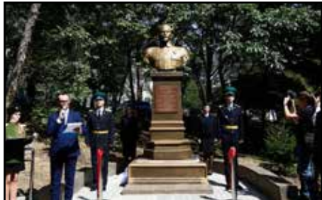
Бюст Дзержинскому в Находке