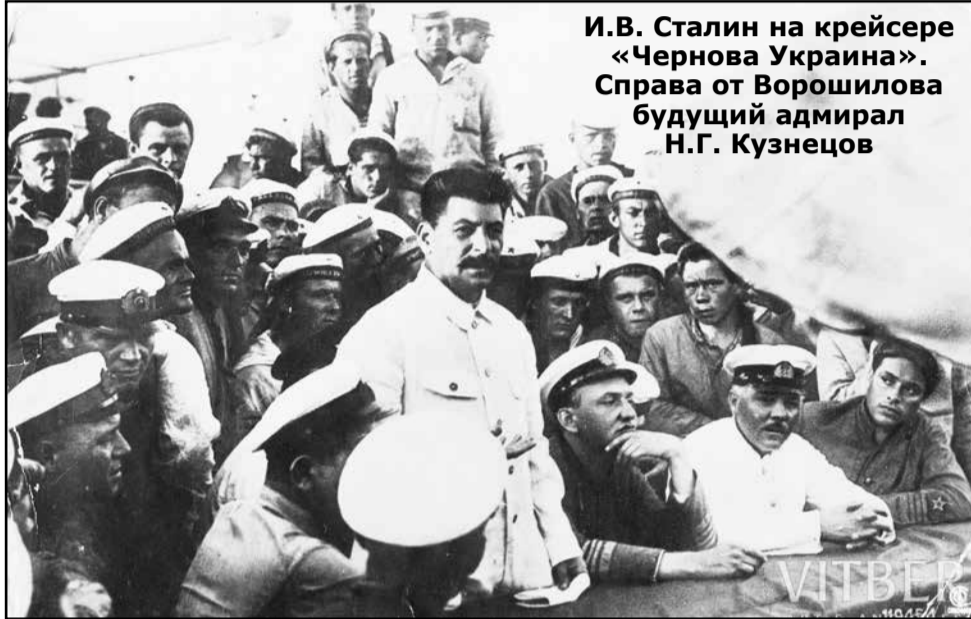
И.В. Сталин на крейсере «Чернова Украина». Справа от Ворошилова будущий адмирал Н.Г. Кузнецов

Наконец, в апреле 1955 г. Кузнецов доложил её на заседании Президиума ЦК КПСС. Против выступил Хрущев. Главком ВМС честно высказал ему своё возмущение безответственным отношением к флоту со стороны первых лиц государства и, в частности, Хрущева и его окружения.