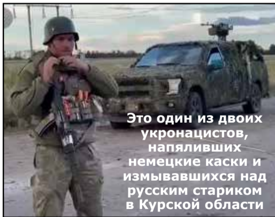
Это один из двоих укронацистов, напяливших немецкие каски и измывавшихся над русским стариком в Курской области

Преступный киевский режим продолжает обстреливать гражданскую инфраструктуру населённых пунктов левобережья Херсонской области, в течение дня 18 августа ВФУ выпустили по н.п. Каховка 3 снаряда, н.п. Новая Каховка – 4, н.п. Горностаевка – 3, н.п. Алёшки – 5, н.п. Каиры – 3.