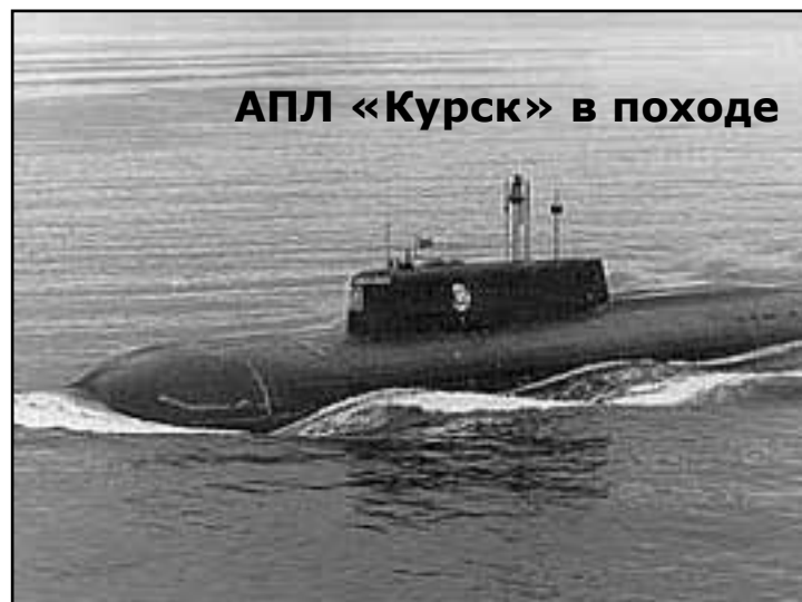
АПЛ «Курск» в походе