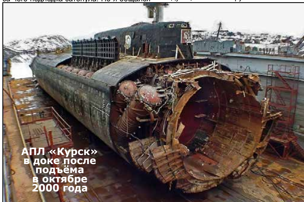
АПЛ «Курск» в доке после подъёма в октябре 2000 года

Американские газеты правды от Пентагона так и не добились. Ну, американцам замалчивать информацию в данном случае выгодно. Но почему российские власти заняли такую удобную для США позицию? Такая лодка уничтожена, 118 моряков погибло. Действительно, приняли откуп от США? Вопрос из вопросов.