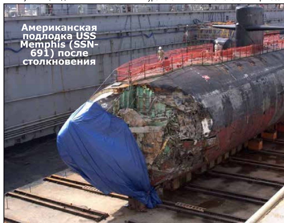
Американская подлодка USS Memphis (SSN- 691) после столкновения