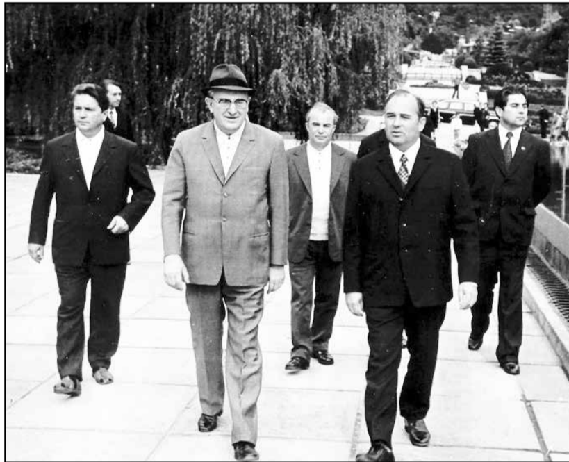
Андропов и Горбачёв

Егора Лигачева, в чьем ведении вскоре оказались все партийные и хозяйственные кадры ЦК КПСС. Так Андропов получил возможность всюду расставлять своих людей, оставаясь до поры до времени в тени. Деятельность Егора Кузьмича высоко оценил один из западных политологов: «Первостепенной задачей Лигачева было осуществление «революции Андропова» среди руководства областных и краевых партийных организаций. К концу 1983 года было сменено 20 процентов первых секретарей обкомов партии, 22 процента членов Совета Министров, а также значительное число высшего руководства аппарата ЦК... Эти перестановки упрочили возможность нововведений Андропова». А вот советские люди даже не подозревали, в какой заднице окажутся через несколько лет. Они полагали, что Андропов просто «закручивает гайки» в разболтавшейся системе и прижимает казнокрадов. Но он всё-таки молодец, наводит порядок, да и цену на водку снизил. В конце декабря 1983 года, – вспоминает Лигачев, – позвонил мне