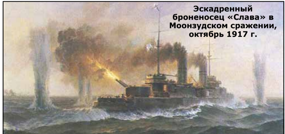
Эскадренный броненосец «Слава» в Моонзудском сражении, октябрь 1917 г.

Но и не Германия, в свою очередь, была главным противником русской армии на Восточном фронте. Австрийская армия по боеиспособности примерно равнялась российской, и потому Россия проводила свои наступательные операции в основном на австрийско-русском участке фронта. Наиболее же успешным участком