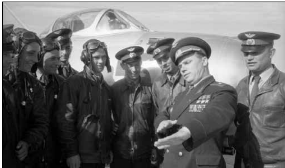
Генерал-майор авиации Иван Никитович Кожедуб с лётчиками 324-й дивизии