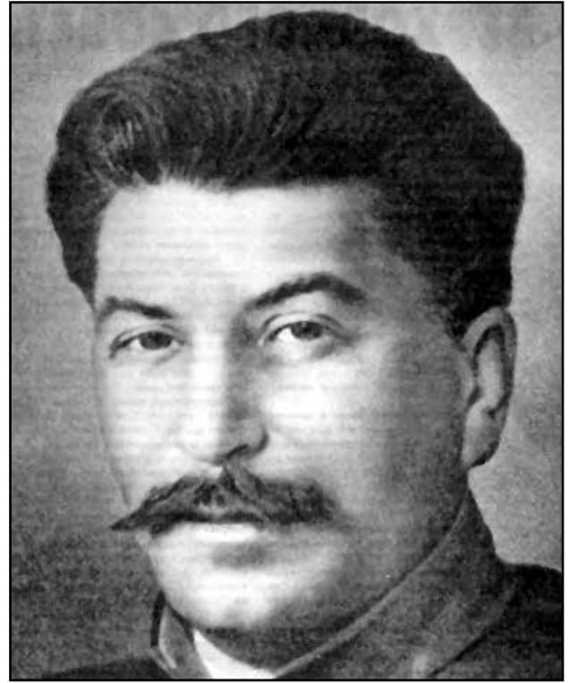
Окончание. Начало на 4 стр.

Таким вот он был – неофициальный Генеральный «с необъятной властью». И за всю эту свою необъятную, бессменную работу на всех должностях и постах – единственной наградой, которой он дорожил, гордился и носил постоянно, была Золотая медаль «Серп и Молот» Героя Социалистического Труда №1. Которой был награжден Указом Президиума Верховного Совета СССР 20 декабря 1939 г. «За исключительные заслуги в деле организации Большевицской партии, построения социалистического общества в СССР и укрепления дружбы между народами Советского Союза» в связи с 60-летием со дня рождения. И именно в ней видел весь смысл своей жизни – в мирном труде на благо социалистического Отечества.