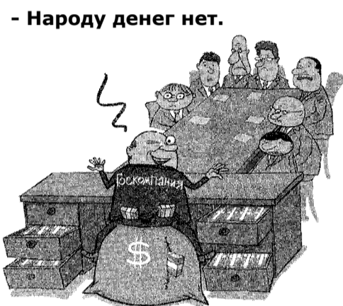
- Народу денег нет.